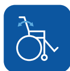
Ângulo do encosto ▾