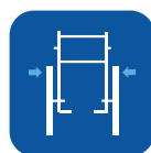
Largura total ▾