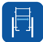
Largura do assento ▾

Para uma informação mais legível sobre este produto, incluindo o manual de utilizador, consulte por favor o site www.invacare.pt