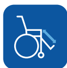
Comprimento dos apoios de pernas ▾