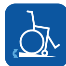
Inclinação máxima para uso do travão de parque ▾