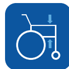
Altura do apoio de braços ▾