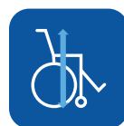
Altura total ▾