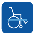
Comprimento total incluindo o apoio de pernas ▾