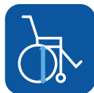
Altura do assento ▾